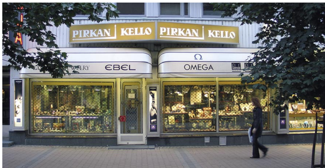
Pirkan Kello on aina ollut Kuninkaankadulla, Tampereen sydämessä.