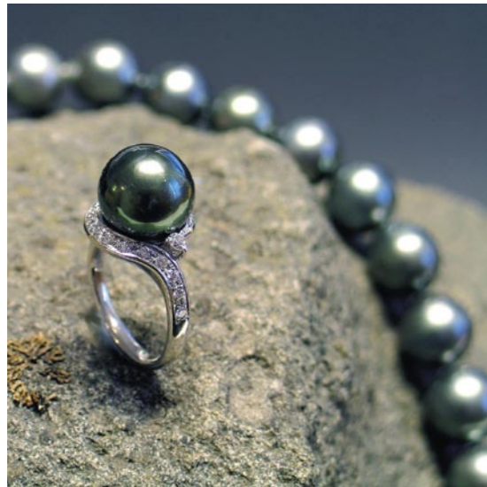
Tummiä Etelänmeren helmiä kutsutaan Tahiti-helmiksi. Ne heijastavat oman värinsä lisäksi myös muita värisävyjä, mikä tekee niistä ainutlaatuisen kauniita.

saaneita arvoesineitä. Tai suunnitellaan yhdessä asiakkaan kanssa uusia malleja uniikitöiksi. Alan monipuolisuus sykähdyttää Kangasniemen sisarusia.