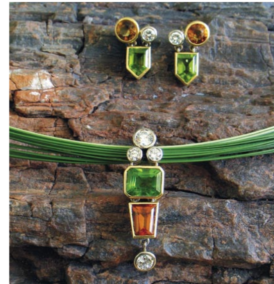
Tähän persoonalliseen korusarjaan on käytetty jalokivinä peridootteja, sitriinejä ja timantteja.

tui hyvin arvosanoin kellosepäksi jouluna 1949. Plakkariin työnnettiin ensimmäinen itse valmistettu taskukello.